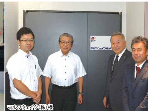
マルワケイコ(株)様