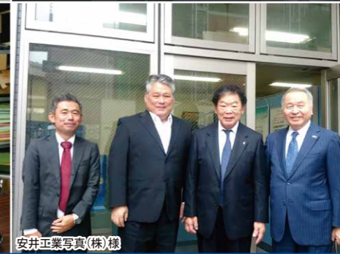
安井工業写真(株)様