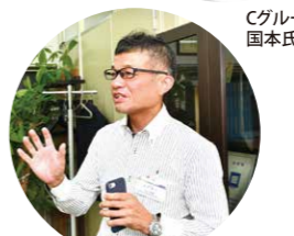
飛び入り発表 猪木氏