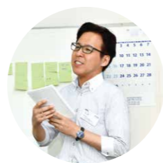
Bグループ発表 仲間氏

まとめ・発表 ●ハザードマップを作成している同業者がある。 ●クリアファイル、ネット受注で納品などの手間が省けている。 ●ご朱印帳、オリジナリティを出す。B to B. B to C両方好調。 ●お茶の販売、サービスorコミュニケーションのツールの1つ。ユーザー先への訪問回数が増える。 ●ゼネコンがメインユーザーで工事現場へ直接アタックをかけまくる。最終的にこれという結論は出なかった。