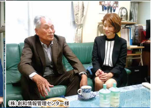
(株)創和情報管理センター様