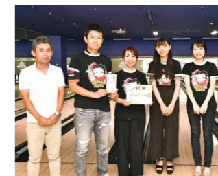
ブービー賞 ダイビスBチーム様

来年度は9月6日(日)をおさえてあります。今回ご参加頂いた方、予定が合わなかった方、どうぞ、次回のご予定を宜しくお願い致します。ご参加頂き誠に有難うございました。