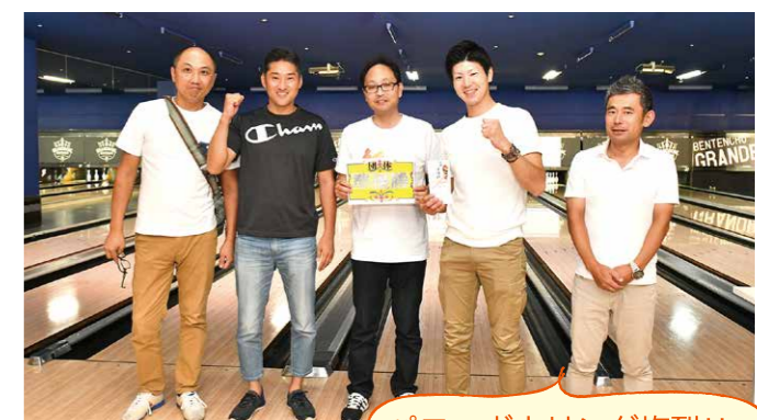
準優勝 (株)田村コピー様