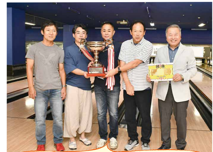
(株)ダイビスAチーム様 優勝おめでとうございます!

なお新しい会場で運営には不慣れなために、行き届きな点多々あったかと存じます。その節は大変申し訳なくお詫び申し上げますとともに、当組合事務局までご意見を賜りますれば今後の運営の参考とさせていただきます。