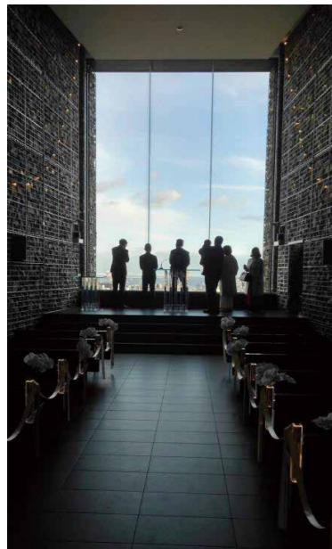
「北野倶楽部 天空のチャペル」 チャペルの厳粛さと神戸の海と青空を眺める人達の対比が面白いです。