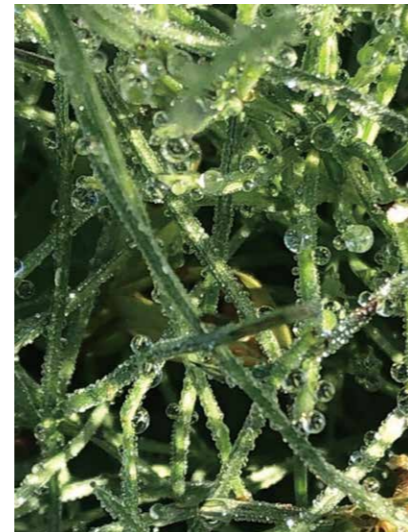
「足元見れば」朝バス停で足元見れば葉先に朝露にがついた様子とのことで、よく発見されました。