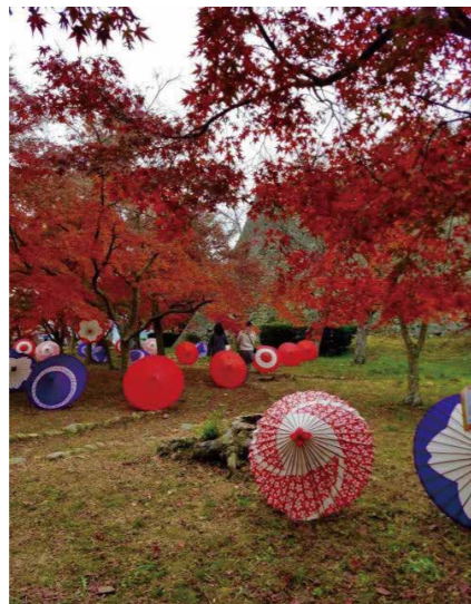
「岡山城 鶴丸公園」紅葉のなか和傘が沢山飾られ、秋の穏やかな一日と華やかさが伝わってきます。