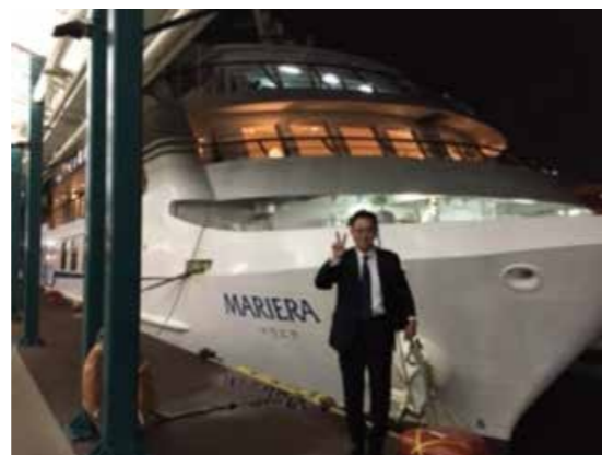
「初めての博多クルーズ」喜びが伝わってきます。新型コロナウイルス騒動前のご乗船だったことでしょう。ご本人のご登場感謝です。