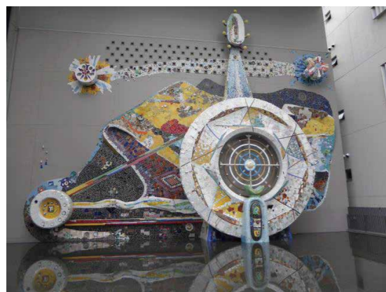
「日本のガウディー」ユニークな形ですね。未来永劫に創り足されて行くのでしょうか？また来年、5年後、10年後…画像楽しみです。